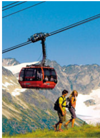
Whistler Blackcomb Mountain Peak 2 Peak Gondel