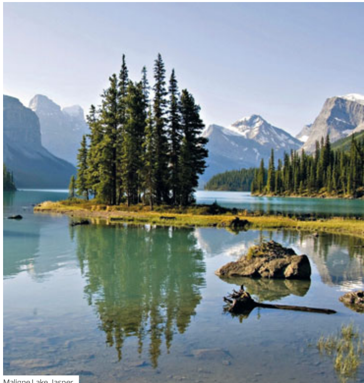
Maligne Lake, Jasper

Rundreise inkl. Flug ab/bis Deutschland pro Person ab € 3.554